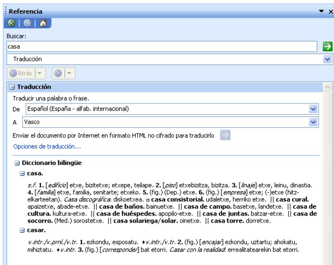
Imagen 3: Ejemplo de consulta (II)

El proceso de lematización resulta especialmente interesante en el caso del euskera, aunque también se aplica en el del castellano. Por ejemplo, si consultamos la palabra casa nos aparecerán los lemas casa y casar (véase imagen 3).