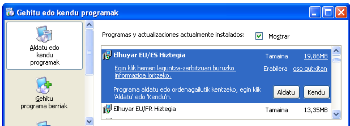
Imagen 4: Pantalla de instalación o desinstalación de programas

Una vez hecho lo anterior, desaparecerán de nuestro sistema todos los diccionarios y bibliotecas de las que se vale el producto.