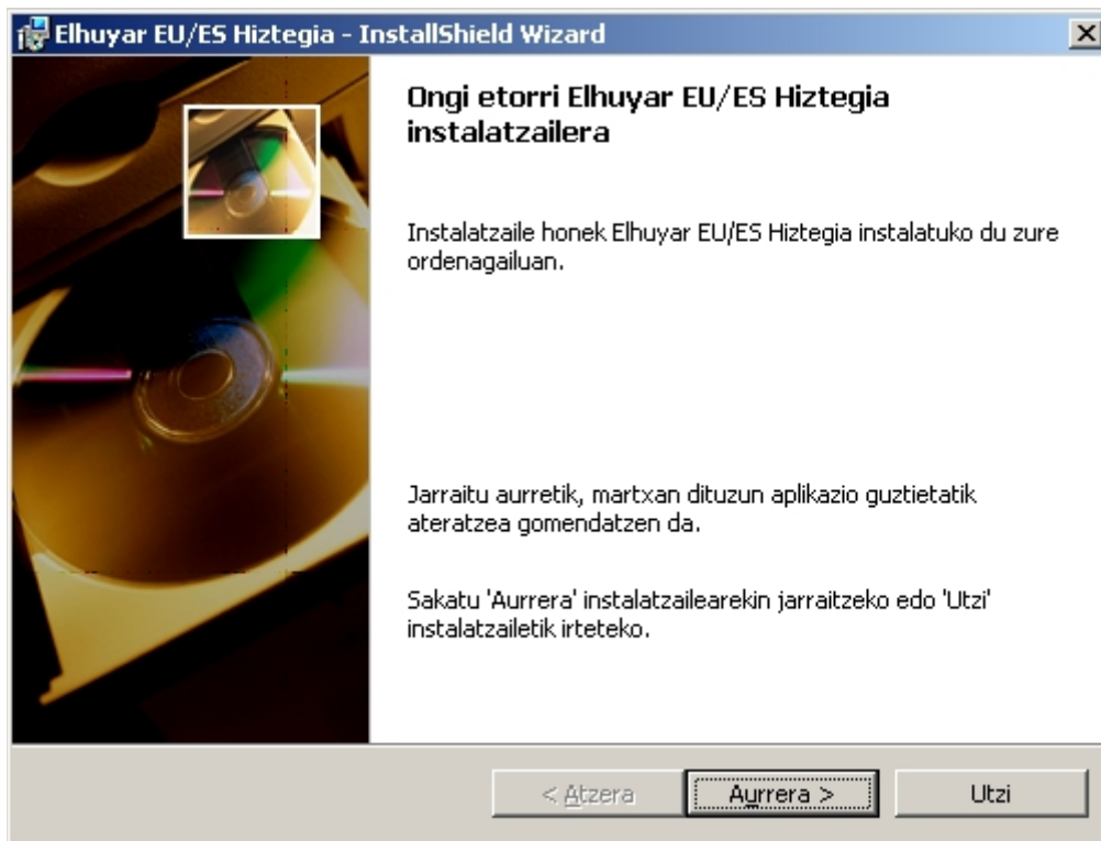
Imagen 1: Primera pantalla del instalador