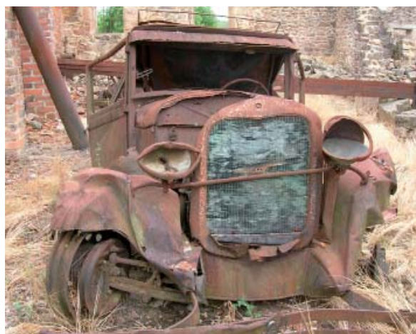
Autoa ugerrak jana du.

Erraz aurki daitezke alderdi kromatikotik haragokoak eta atsotitz baten harira – Gaina eder, barren uher – gogora dezakegu aldaera – Sagar gorri(a)k barrena ustel– eta besteei bidea eman: Hire etsai bihotz-uherrak / Gaitzesten duzu bere borondate uherragatik / Omen