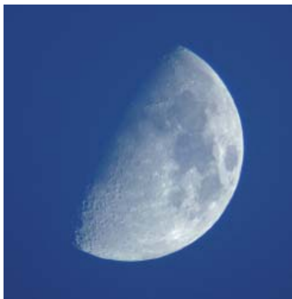
Ilargiaren argi ubela.

Hala ere, eremu irristakorretik ibili beharko dugu oraingoan ere, beste multzo bat identifika baitezakegu Orotarikoak dakartzan adiera hauen inguruan: páldo,