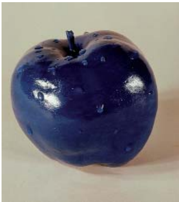
Objektuaren identifikazioa lehenesten dugu, ñabardura kromatikoak izanik ere.

funtzionatzeko eran dugu erantzuna: zentzumenek aldaketa, ñabardura eta zehaztasunak jaso egiten dituzte, bai, baina gure hautemateak finkatzen ditu lehentasunak eta, halako baldintzapean ikusita ere, gehiago interesatzen zaio objektuaren identifikazioa ñabardura kromatikoa baino. Errealitatea egonkor eta iraunkor agertzea garrantzia handikoa da guretzat; gauzakiek itxura mantentzen duten bitartean beraiek identifikatzea, komunikatzea erraz dugu; baldintzak eta eragiten dituzten aldaketak bigarren mailan gelditzen dira premiazkoa den identifikazioaren ondoan.