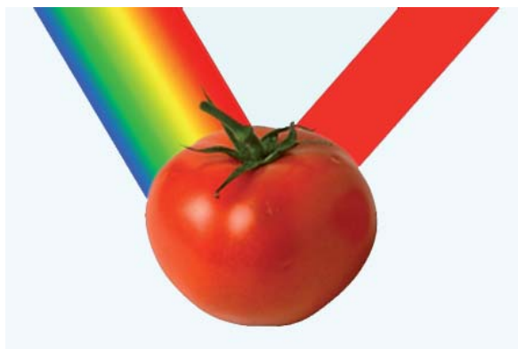
Tomateak erradiazioak jaso, xurgatu eta kanporatu egiten ditu

Honek erlazio zuzena du hasieran planteatutako uste oker horrekin; izan ere, gure kaleko hizkeran «tomate kolorea» diogunean (berez itxura aldakorra duenaren gainetik abstrakzioa eginda) tomate sasoitsuari atxikia ikusten diogun gorritasun hori ari gara aipatzen, baina –hauxe paradoxa!– izatez tomate horrek uhin luzera