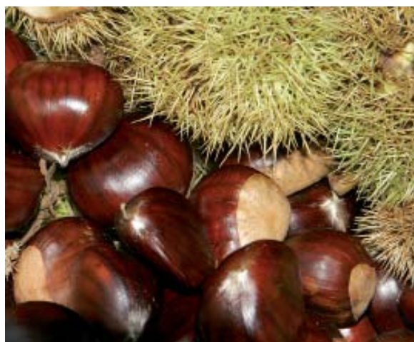
Gastainak nabartzen ari dira.

Dena dela, koloreei ez ezik itxura orokorrari ere ematen zaion garrantzia biziki kontuan hartzeko datua dela ezin ahanzturan utzi. Nabar hitza erabilia egoera definikaitz