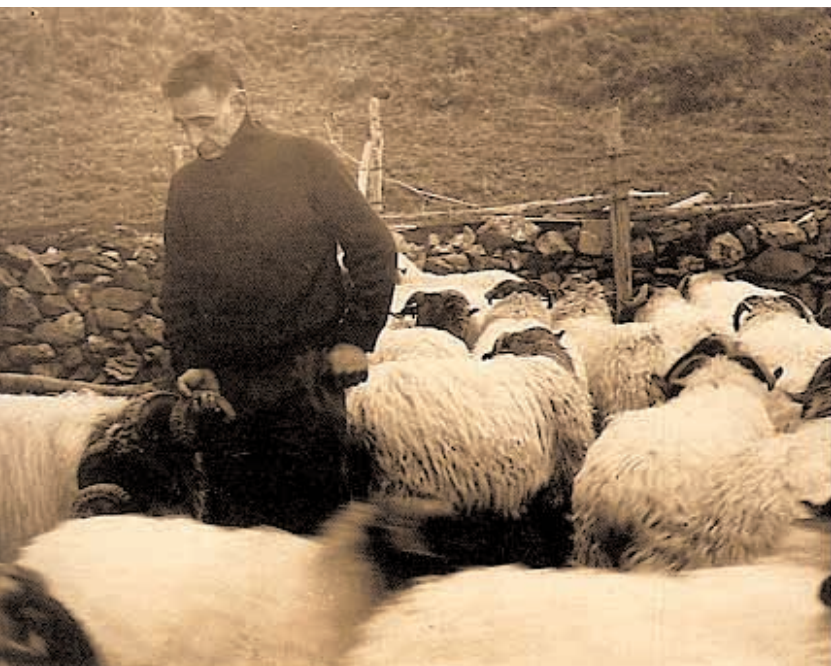
Hamalau urterekin hartu zuen artaldea bere gain Xalbadorrek, hala ere, berak nahi baino beranduago.

"Iparretik hotzik datorken aizearen gordabian, etxetik urrun han dago artzain etxola mendian".