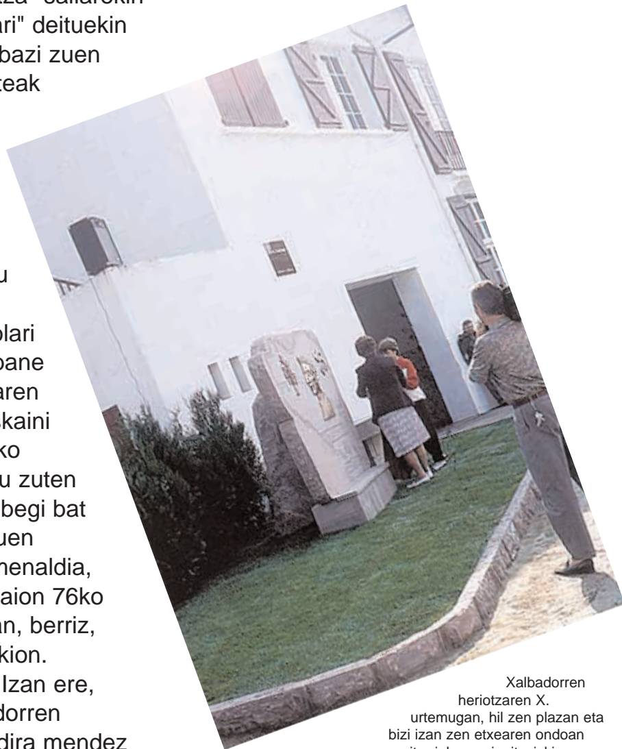
Xalbadorren heriotzaren X. urtemugan, hil zen plazan eta bizi izan zen etxearen ondoan oroitarriak ezarri zitzaizkion.

Omenaldiak, berriz, hiru jaso zituen: lehenengoa Donostian 1969an Bertsolari Egunaz; bigarrena, Donibane Lohizunen 1976ko uztailaren 20an. Urrezko domina eskaini zioten egun hartan "herriko seme kuttun" ere izendatu zuten donibandarrek, ordurako begi bat galdua eta bihotza eri zituen Xalbadorri. Hirugarren omenaldia, Urepelen bertan egin zitzaion 76ko azaroaren 7an. Hil ondoan, berriz, herri askotan egin zitzaizkion. Sorterrian, berriz, urtero. Izan ere, Xalbador bera eta Xalbadorren bertsoak gogoan izango dira mendez mende.