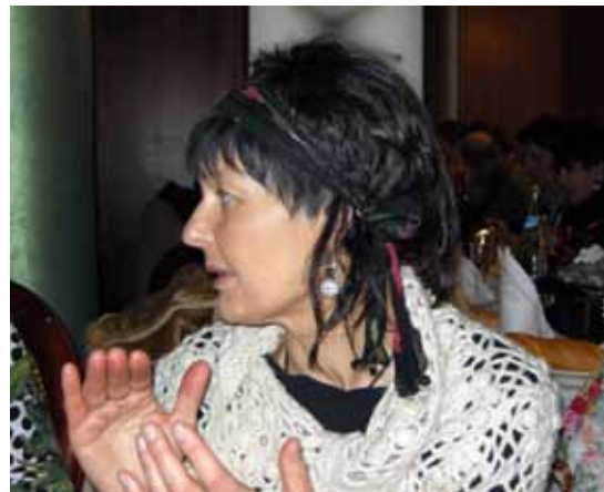
Karmele 2000ko hamarkadan