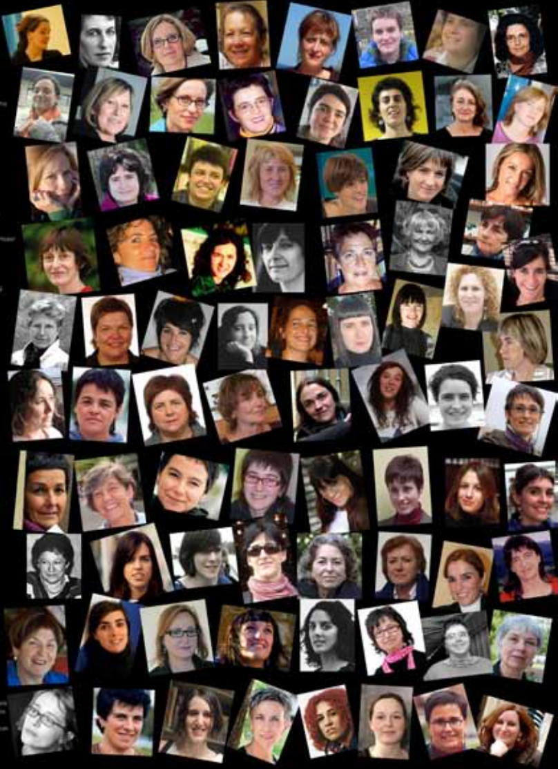
Euskal emakume idazleak. Euskal PEN Klubaren posterra, 2011