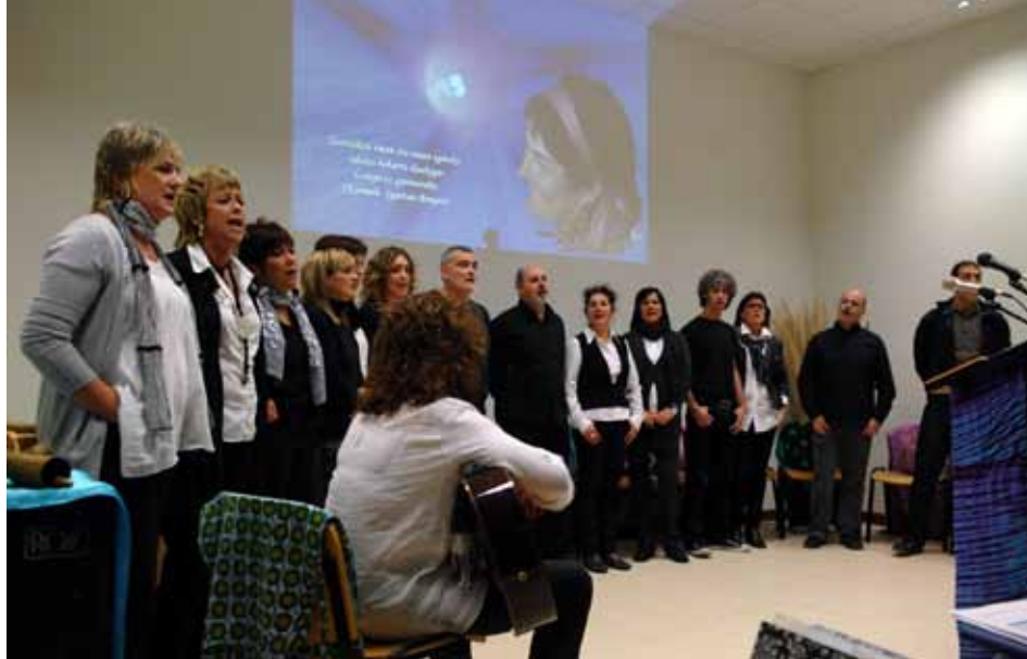
K. Igartuari Bergarako Idazle Eskolan egin zitzaion omenaldikoa, 2010eko azaroan