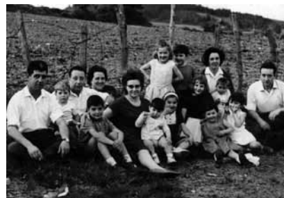
Gurasoak, neba-arrebak eta Bengoatar batzuk, 1965 inguruan