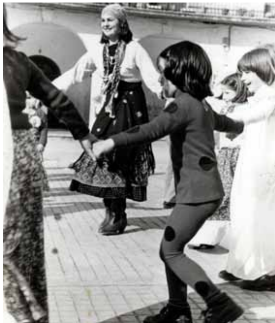
Andereño Aretxabaletan. Inauterietan haurrekin dantzan