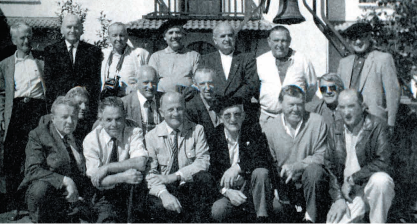
Uztaritzeko seminarioko ikasle ohiak, 60 urte geroago elkartu zirenean