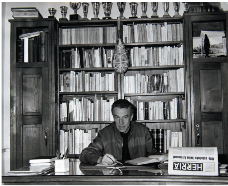
Herria astekariaren bulegoan

tzen zion, euskaraz huts bat egiten zuelarik. Oharkabean eta naturalki lortu zuen euskara maila aberatsa.