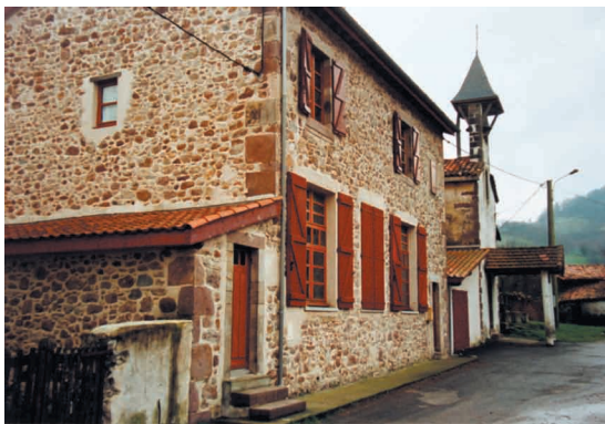
Urdoz auzoko kapera