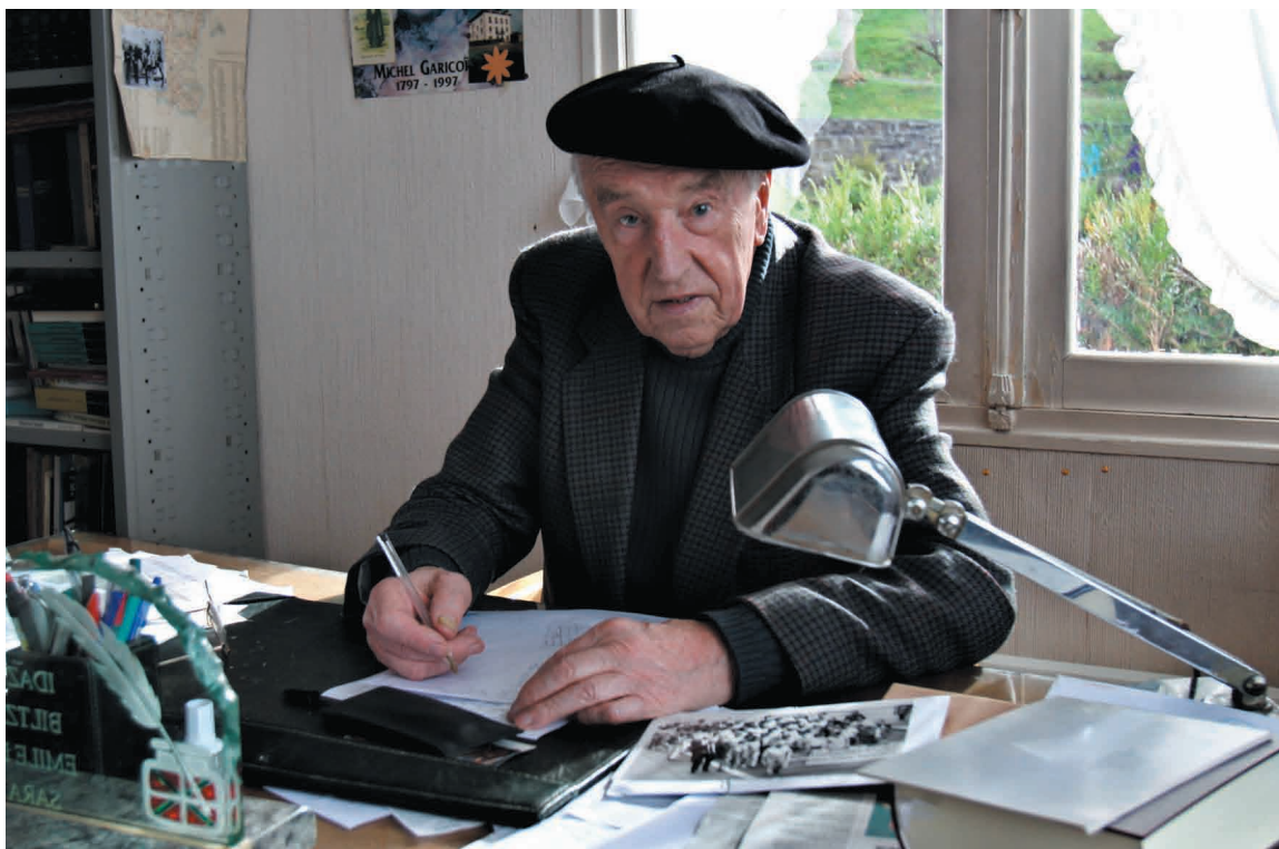
Emile etxean, Donibane Garazin

danik bazuen liburu bat idatzia, euskaraz, zeruari buruz.