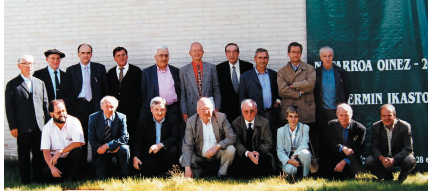
Euskaltzain osoak Nafarroa Oinez-eko ekitaldi batean, 2000n

Hortik landa, itzulpen horren ezagupen ofizial baten bila joan ziren Erromara. Eta ofizialtasuna onartu zieten.