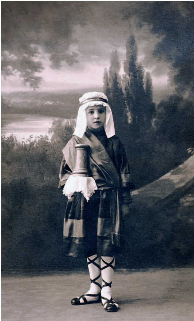
Eskola garaian, zortzi urte zituela, dotore-dotore jantzita