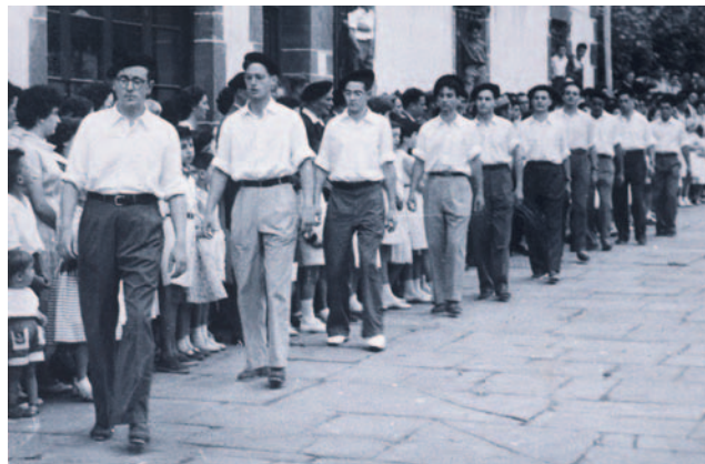
1955eko Santiago egunean, aitzindari zela