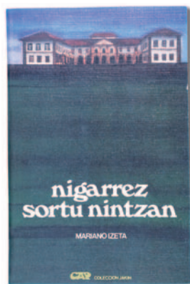
Nigarrez sortu nintzan (1982)