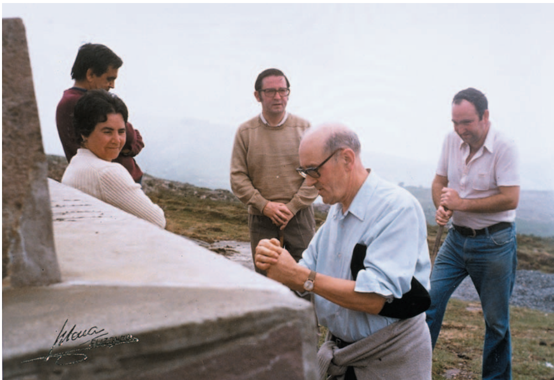
Legate mendia zen bere txokorik kuttunenetakoa, eta bertara igotako kopurua zenbaturik zuen. Argazkian 100. aldia

Idazteko grina hori kazetaritza eta literatura lanetara ez ezik, eguneroko bizimodura eramane zuen. Berezko memoria izugarria izanagatik ere, gauza guztiak idazteko ohitura zuen. «Duela 50 urtekoak ez zaizkit atzentzen, bart gauekoak, ordea, ezin gogoratu zabil», aitortu zuen Argia aldizkarian. Ondorioz, lanean