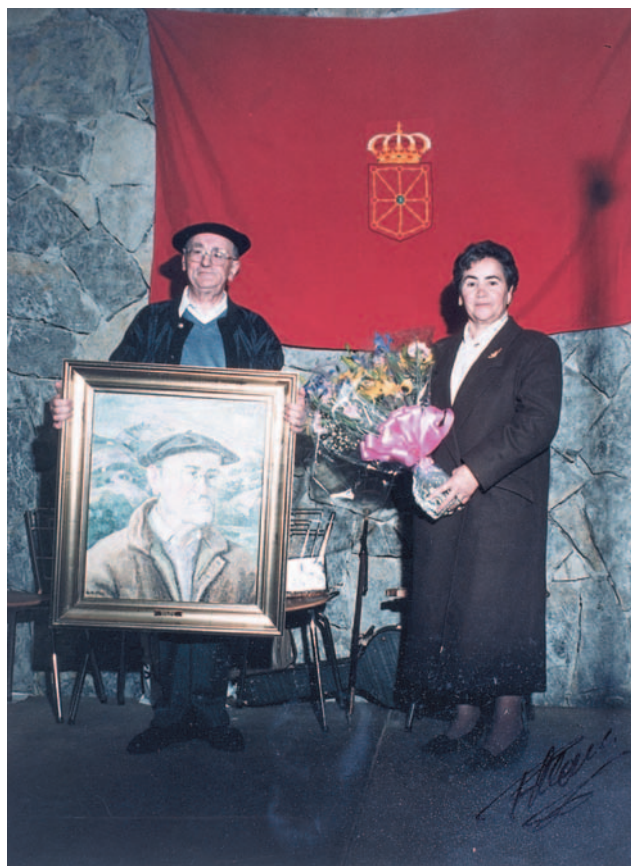
Erratari lanak bete zituen hainbertze denboran. Xorroxin Irratiak omenaldi berezia eskaini zion 1990ean

Kazetari lanekin hasitako ibilbideak jarraipenik izan zuen literaturarekin. «Sentimendua beharrezkoa da idazterako orduan», aitortu zuen. Ipuinak idazten hasi zen, herri-ipuinak nagusiki, eta horiek bildu zituen gerora Nigarrez sortu nintzan liburuan, eta Arantzazu aldizkarian. Sorgiñak infernuko errekan ipuina Bizkaiko Foru Aldundiak eta Eusko Jaurla-