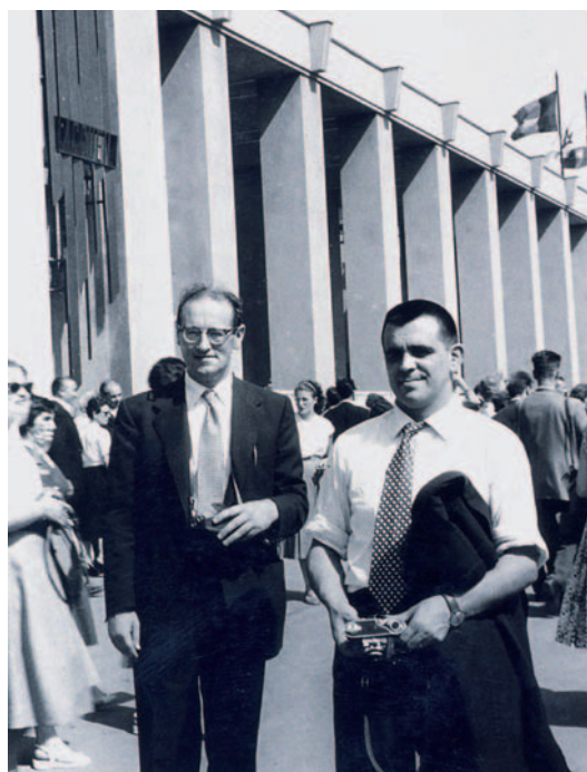
Belgikara joan zen kantura 1958an

Dantzarekin bezala, Elizondoko abesbatzarekin ere urte anitz eman zituen kantuan. Europako lurretan barna bidaiatzeko parada izan zuen horri esker, bertzeak bertze Londres eta Bruselan izan zen kantuan. 1952an Llangolenera joan zen Elizondoko Koralarrekin, eta lehenbiziko saria jaso zuen han.