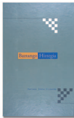
Baztango hiztegia (1996)