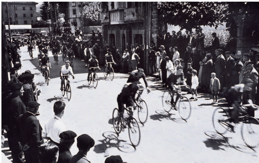
Kirola zen bertze pasioetakoa, eta txirrindula gainean ere ibili zen. Irudia 1933an hartua da, eta proba horretan laugarren tokian gelditu zen

Bizi egiten zituen mutil-dantzak, eta hala agertarazi zuen elkarrizketa batean. «Haurretan ikasi nituen, hamabi urtetako. Elizondon badi-