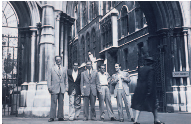
Elizondoko abesbatzarekin 1952an, Londresen