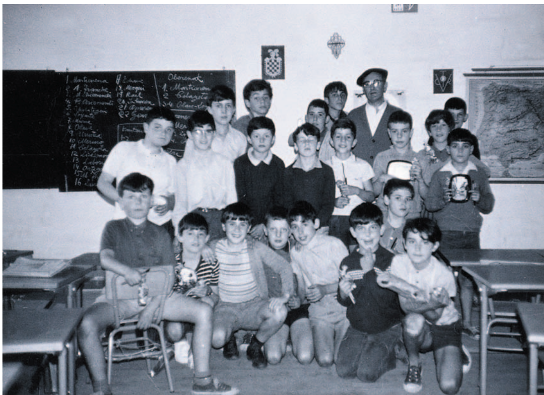
Euskara hedatzeko edozein ahalegin zen guti, eta eskolako ikasleei euskara irakatsi zien garai batean