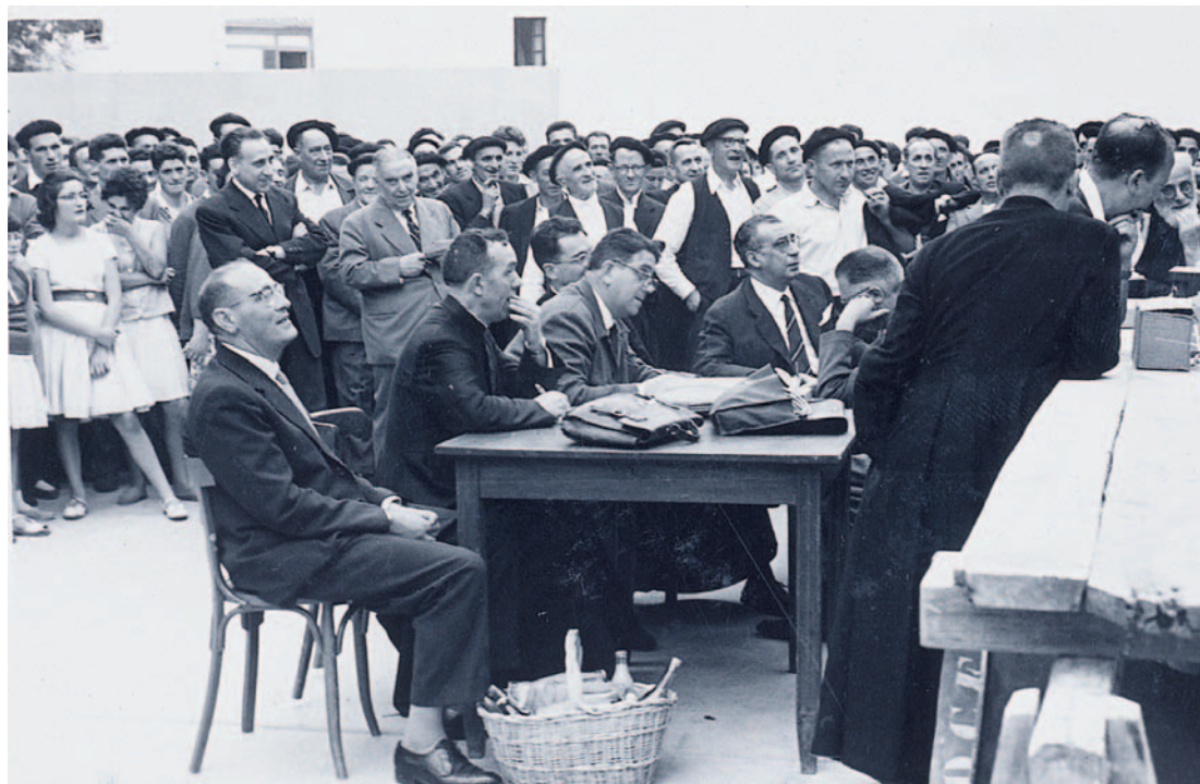
Eragile, antolatzaile, aurkezle eta epaimahaikide izan zen Nafarroako Bertso Txapelketan. Argazkia 1960ko uztailaren 25ean ateratakoa da, Elizondon