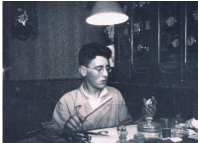
Gaztetandik hasi zen lanean erloju-dendan, aitarekin. Irudia 18 urte zituela aterata dago