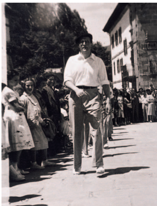
15 urtekin hasi zen Mutil-dantza dantzaten, eta 50 urte baino gehiagotan jardun zuen