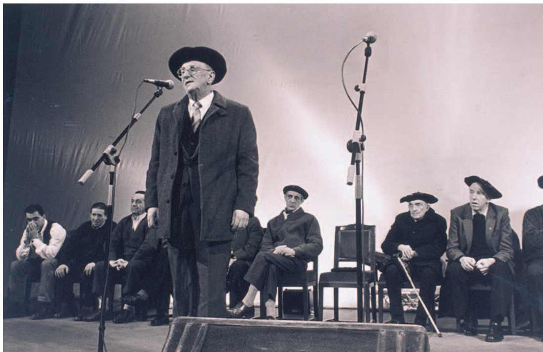
1992ko urtarrilaren 19an, Bertso Egunean, omenaldi beroa jaso zuen

ren 27an. Urte hartan hirugarren omenaldi bat egin zioten, Gipuzkoako Dantzari Elkartearen eskutik honakoa, Donostian.