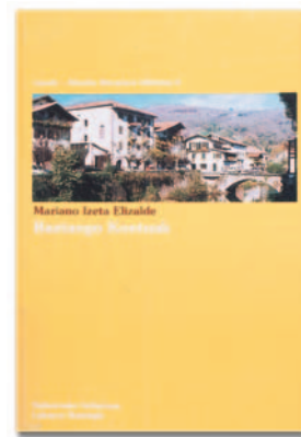
Baztango kontuak (1999)