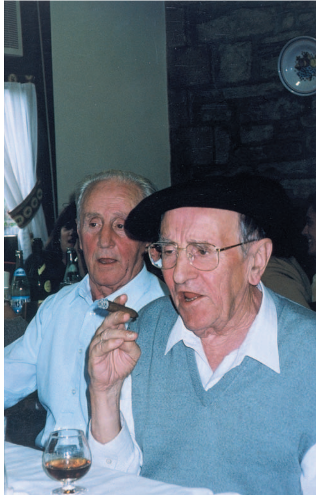
Bazkalostean kantuan aritzea ikaragarri maite zuen. Argazkia 1998ko apirilaren 26an ateratakoa da

ezer egiteko asmorik», erranketu zuen. Baina, oro har, kantatzea izugarri maite zuen, eta afa-londoko giroetan ohikoa izaten zen Mariano kantuan sumatzea. Euskal kantuekiko grina bizikoa zen.