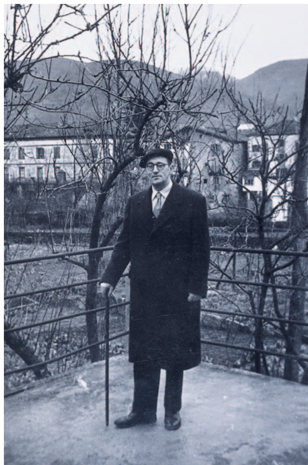
Politikagintzan bere ibilbidea egin zuen, tartean Elizondoko alkate izan zen