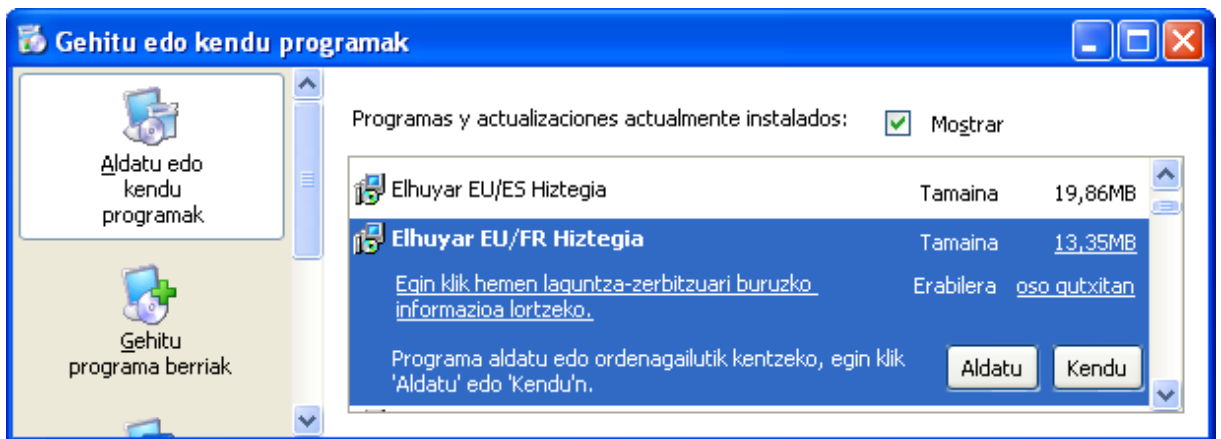
Image 4 : Écran d'installation ou de désinstallation de programmes.

Dans la liste de la fiche Désinstaller ou Modifier un programme , cliquez deux fois sur l'option « Elhuyar EU/EF Hiztegia » (voir image 4).